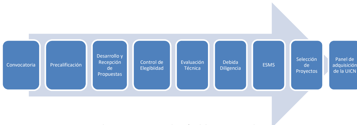
Figura 3. Proceso de Convocatoria y Selección del Mecanismo de Donaciones

Este proceso se desarrolla en nueve fases consecutivas, desde la convocatoria hasta la selección final de los proyectos.