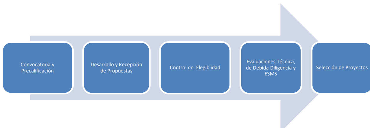
Figura 2. Proceso de Convocatoria y Selección del Mecanismo de Donaciones

Este proceso se desarrolla en cinco fases consecutivas, desde la convocatoria hasta la selección final de los proyectos.