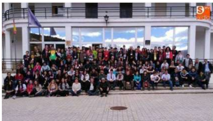
Fig. 1. Grupo de participantes con sus profesores acompañantes y organizadores.

La Fase Nacional de las Olimpiadas de Geología tuvo lugar el día 1 de abril en Béjar (Salamanca) y a ella acudieron los ganadores de cada Fase Territorial. La Fase Territorial contó con la participación de 2.843 estudiantes. En la Fase Nacional participaron 84 estudiantes con sus profesores acompañantes (Figura 1) que procedían de 37 sedes.