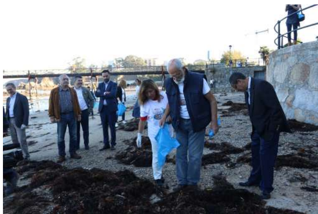
La Conselleira de Medio Ambiente e Ordenación do Territorio de la Xunta de Galicia en la playa de Santa Cruz.