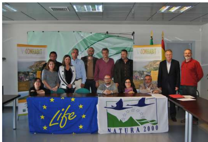
ALMERÍA. Reunión ayuntamientos

Y también en las RRSS: Facebook y Twitter.