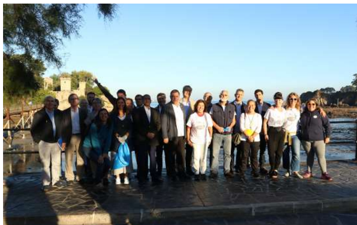
Algunos participantes y ponentes en la jornada posan con la Conselleira de Medio Ambiente antes de bajar a la playa en el acto de desagravio al mar.

Tras la reunión se acordó por un lado, trasladar a UICN la necesidad de actualizar la legislación sobre vertidos de aguas negras y grises en alta mar y por otro dar apoyo a los pescadores en su propuesta de ampliación de la Reserva Marina.