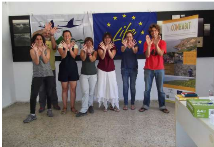
CÁDIZ. Reunión empresas turísticas