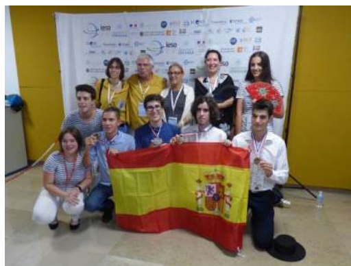
Fig. 2. Alumnos, voluntarios y profesores del equipo español.

Aparte de los estudiantes y sus profesores, este éxito ha sido posible gracias a la colaboración de numerosas personas e instituciones. La entidad organizadora, la Asociación Española para la Enseñanza de las Ciencias de la Tierra (AEPECT) quiere agradecer a los miembros de GeoSen por las jornadas de formación para nuestro seleccionado, así como a la Sociedad Geológica Española (SGE), el Instituto Geológico y Minero de España (IGME), al Ministerio de Economía, Industria y Competitividad Educación, Cultura y Deporte a través de la FECYT y al Ministerio de Educación, Cultura y Deporte a través del CNIIE.