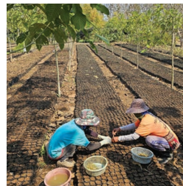
Las fotos proceden del Bosque Modelo Ngao, Tailandia, con crédito a la Asociación del Bosque Modelo Ngao.