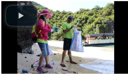
Giới trẻ chung tay làm sạch những hòn đảo ngập rác ở Vịnh Hạ Long

Chiều 14/6, sau những đường sóng gập ghềnh, lướt qua từng "quả núi di sản," hơn 100 tình nguyện viên đến từ các cơ quan nhà nước, tổ chức phi chính phủ, các doanh nghiệp, chính quyền địa phương và các bạn trẻ đã đặt chân xuống một số đảo để thực hiện chiến dịch làm sạch biển ở Vịnh Hạ Long – Di sản thiên nhiên thế giới.