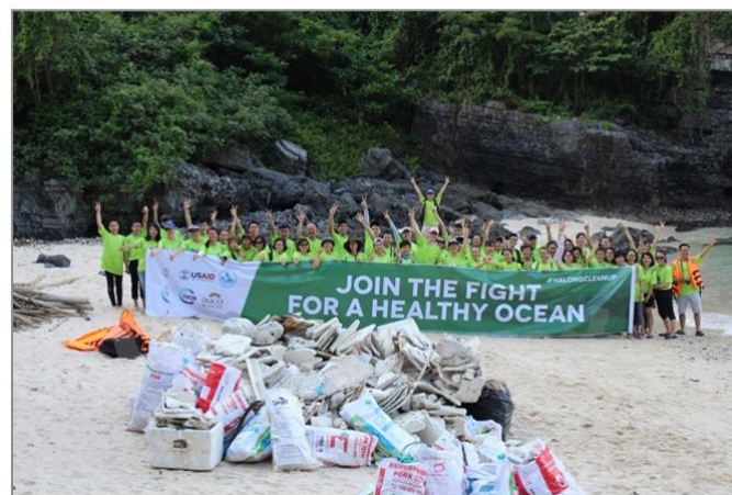
Hơn 100 tình nguyện viên chung tay dọn rác tại một số hòn đảo

Theo nguồn tin từ Tổ chức Bảo tồn Thiên nhiên Quốc tế, sau chương trình này, Tổ chức Bảo tồn Thiên nhiên Quốc tế sẽ tiếp tục huy động sự tham gia của các doanh nghiệp và các bên liên quan để định kỳ tổ chức các hoạt động thu gom rác thải ít nhất 3 tháng/lần tại Vịnh Hạ Long.