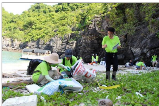
Các nhóm tình nguyện viên chung tay dọn rác trên các đảo Vịnh Hạ Long.

Đồng loạt ra quân Chiến dịch Thanh niên tình nguyện hè 2016