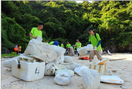
Rất nhiều tấm xốp được các tình nguyện viên thu gom trên đảo.

13 giờ 30 phút, nắng nóng như thiêu như đốt đội thẳng xuống buồng tàu. Thế nhưng, hơn 100 tình nguyện viên đến từ các cơ quan nhà nước, tổ chức phi chính phủ, các doanh nghiệp, chính quyền địa phương và các bạn trẻ vẫn hồ hởi di chuyển ra các hòn đảo nổi thực hiện chiến dịch làm sạch biển ở Vịnh Hạ Long – Di sản thiên nhiên thế giới.