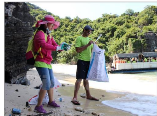
Tình nguyện viên thu gom rác trên các đảo Vịnh Hạ Long.

Vì thế, ngay sau khi các nhóm hoàn thành việc thu gom rác từ các đảo khác, Ban tổ chức Chương trình tình nguyện viên "Hành động vì Hạ Long xanh" đã phải huy động tất cả các tình nguyện viên đến giúp đỡ. Nhờ đó, sau gần 5 tiếng đồng hồ làm sạch đảo, các nhóm tình nguyện viên thu gom được hàng chục bao tải rác, chất cao thành "núi" để đưa lên tàu bàn giao cho đơn vị xử lý rác thải ở thành phố Hạ Long tiêu hủy./.