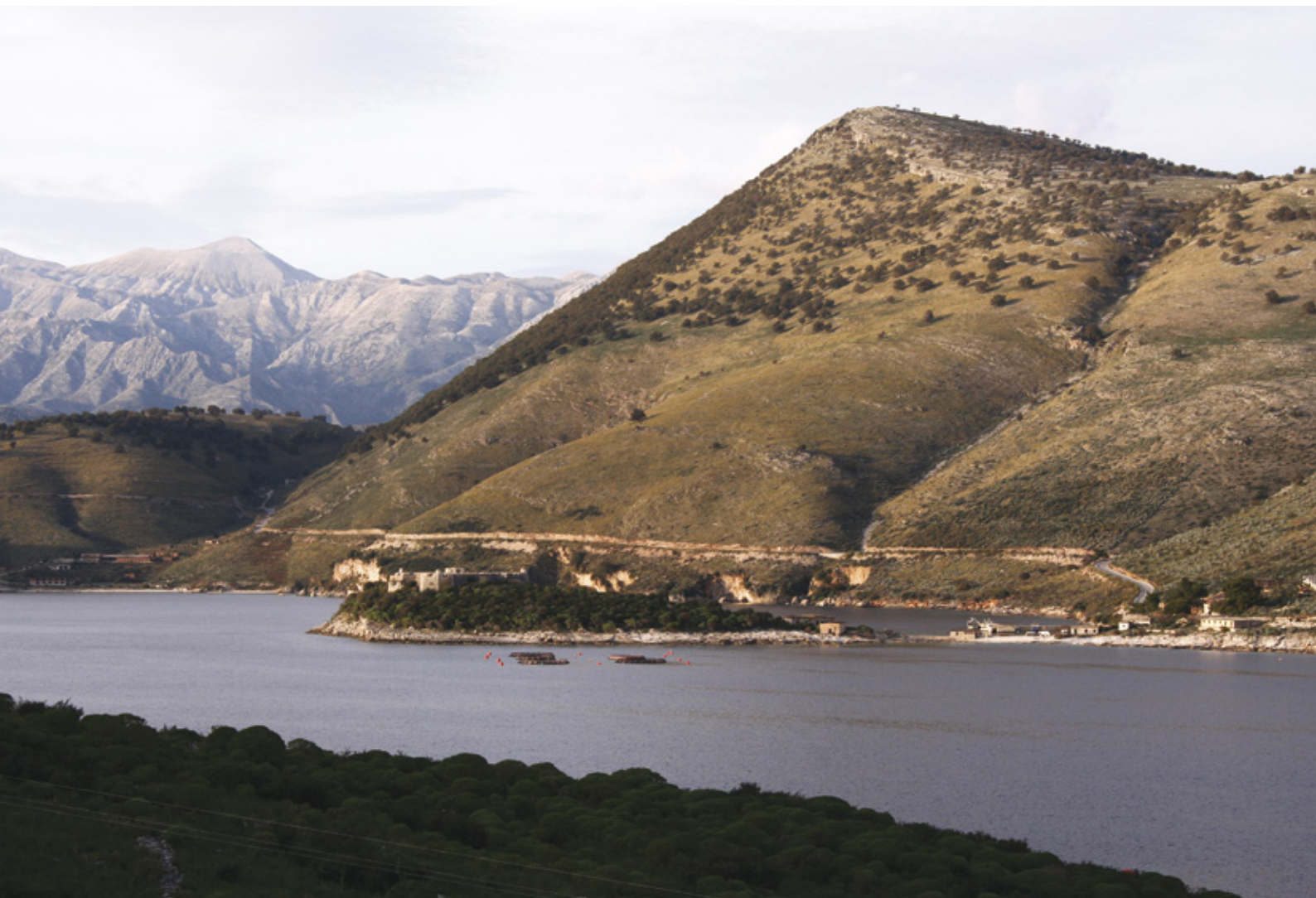
Porto Palermo © INCA.