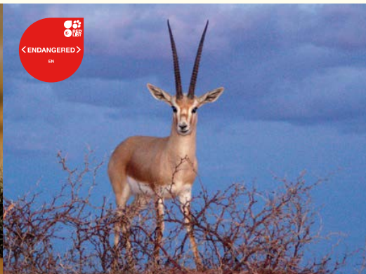
Gazelle leptocère, la reem de l'Afrique du Nord.