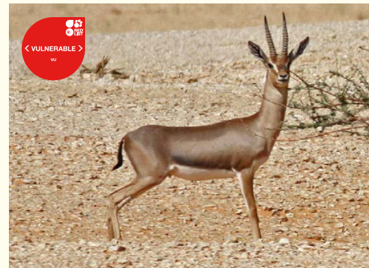
Gazelle d'Arabie, l'idmi la Péninsule arabique.

Les antilopes sont parmi les animaux les plus connus des déserts de l'Afrique du Nord et de la Péninsule arabique. Ces espèces se sont adaptées à un des environnements désertiques les plus extrêmes dans le monde et elles ont toujours été admirées pour leur grâce et leur beauté dans l'art et la poésie de la région. Quoique bien connues dans un sens général, des similitudes étroites entre certaines des plus petites espèces d'Afrique du Nord et l'Arabie ont conduit à la confusion. Cette fiche fournit un résumé des espèces qui habitent naturellement chaque région.