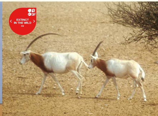
Oryx algazelle.

Afri se réfère à la Gazelle saoudienne ( Gazella saudiya ) de la Péninsule arabique, aujourd'hui malheureusement éteinte, et est également utilisé à certains endroits pour la Gazelle dorcas ( Gazella dorcas ), espèce encore largement répandue en Afrique du Nord.