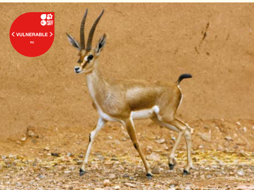
Gazelle de Cuvier, l'edmi d'Afrique du Nord.