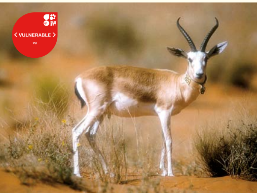
Gazelle des sables, la reem de la Péninsule arabique.