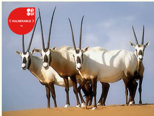
Oryx d'Arabie.