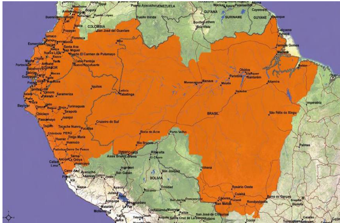
Figura 2: Eje del Amazonas