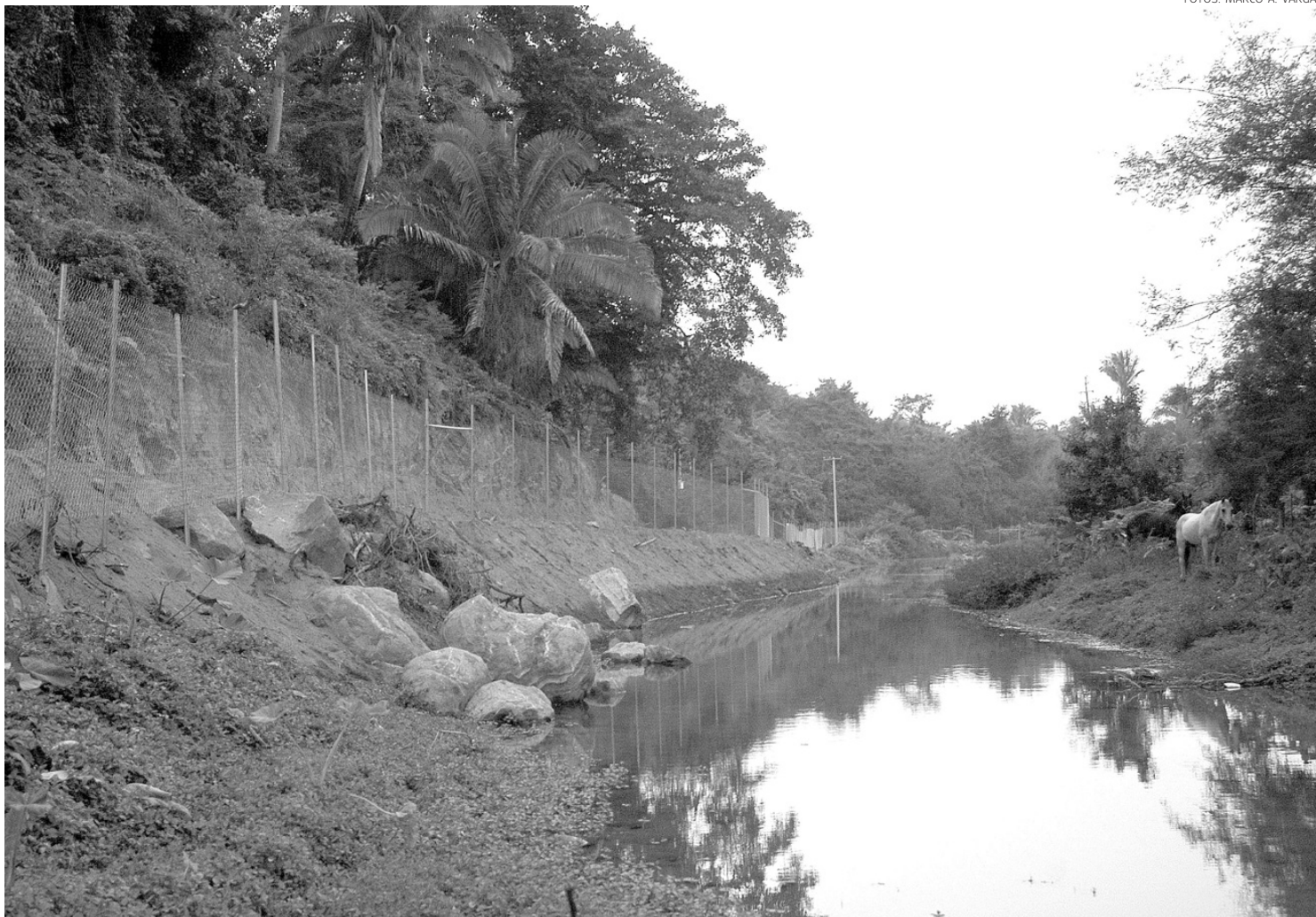
El estero que fluye anexo a San Pancho, también situado por los desarrollos