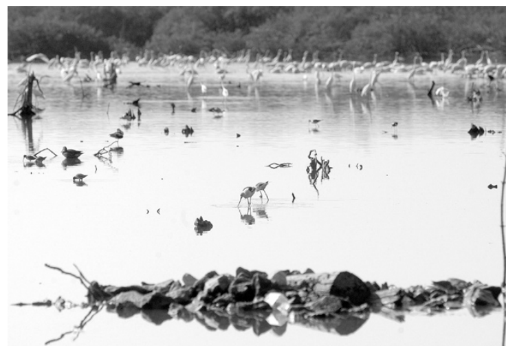
Los esteros son fuente de vida, en San Blas