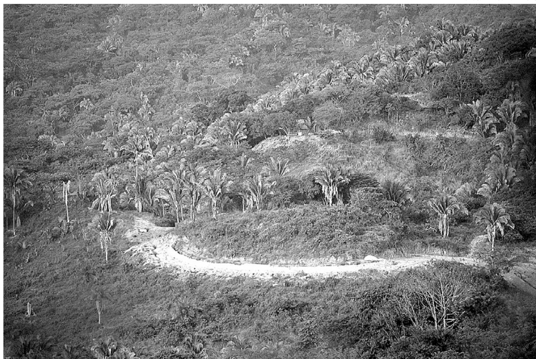
Apertura de camino en medio de un bosque protegido, en las cercanías de San Pancho

Sólo conserva el nombre de Faurest. Borró el pasado “americano” y se dio orígenes