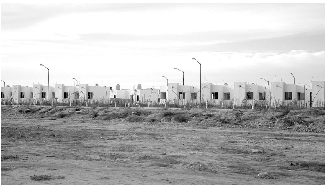
Cerca de Valle de Banderas, los excesos de un crecimiento anárquico

siguiente, en el de La Peñita, en medio de ambas zonas.