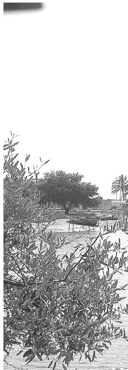
Los restos de un encallamiento cerca de las i

San Francisco, Nayarit > Agustín del Castillo