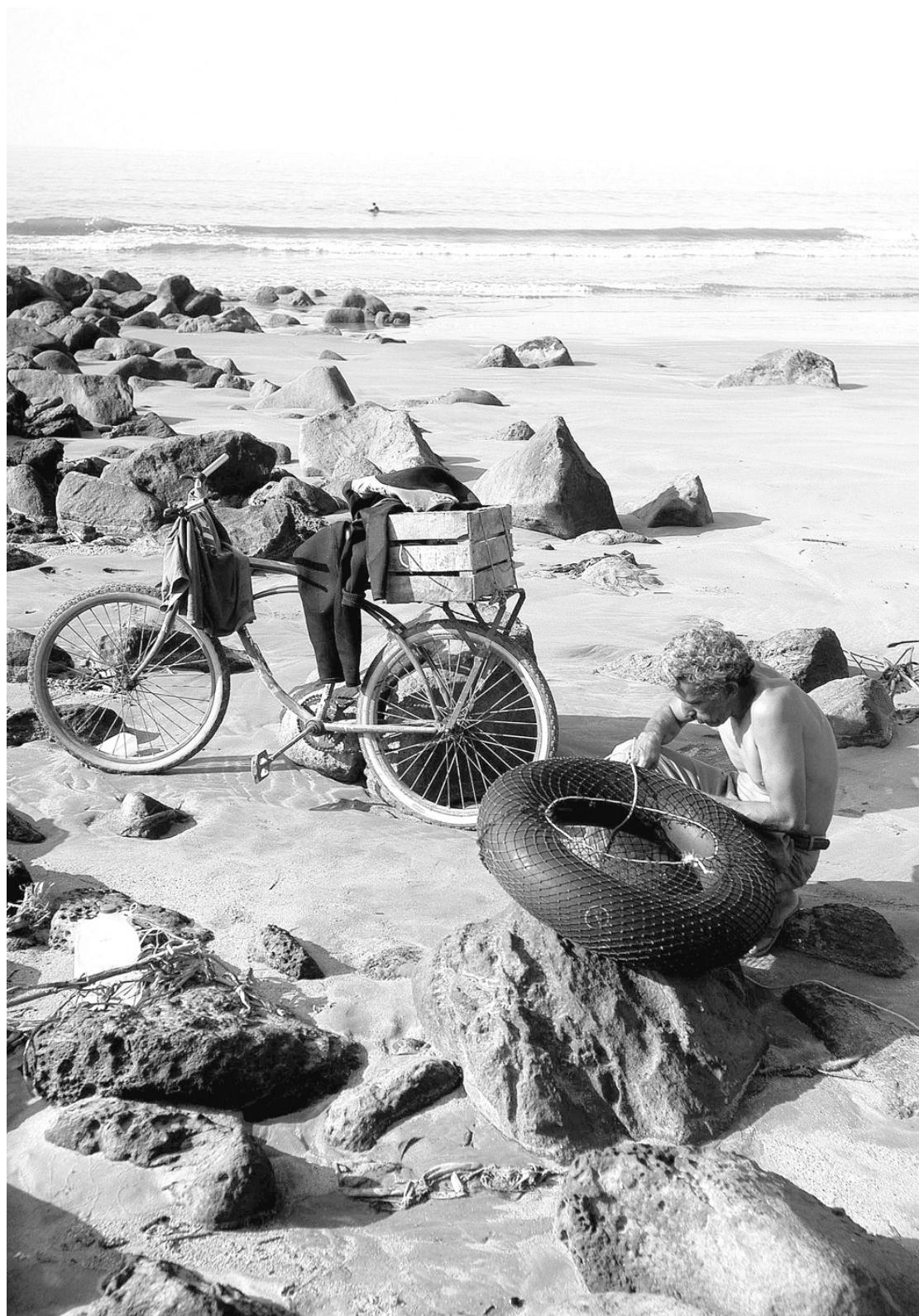
La playa nayarita se abre a la inversión extranjera, con riesgos

El hombre que corrompió a una ciudad. Mark Twain ■ P