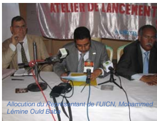
Allocation du Représentant de l'UICN, Mohammed Lémine Ould Baba

Un atelier de lancement du Panel scientifique indépendant sur l'exploitation pétrolière et gazière en Mauritanie organisé par le Ministère Délégué auprès du Premier Ministre chargé de l'Environnement (MDE), en collaboration avec l'UICN, s'est tenu le 25 octobre 2007 à Nouakchott, en Mauritanie.