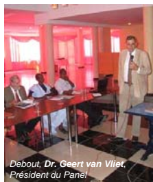
Debout, Dr. Geert van Vliet , Président du Panel

A la fin du processus de recrutement ( cf. encadré page suivante ), le panel indépendant sera constitué d'une équipe de cinq experts nationaux ou étrangers d'envergure internationale qui seront appuyés par des consultants et des doctorants dans l'analyse de thématiques particulières.