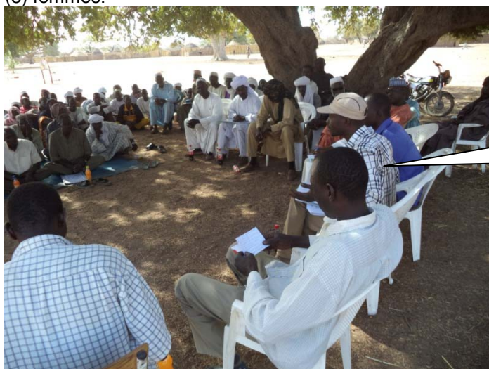
Image : Réunion de concertation entre les leaders communautaire et l'Administration du Parc à Kiéké

ensemble. L'objectif de ce partenariat est de préciser le cadre global de collaboration entre les différents partenaires, ainsi que leurs engagements et responsabilités. La signature du protocole de collaboration est en cours d'exécution. Au total deux (2) réunions de discussions ont été organisées avec la Direction de la Faune et le PNZ en Mai 2014 et Juin 2014 et 132 personnes y ont pris part dont cinq (5) femmes.