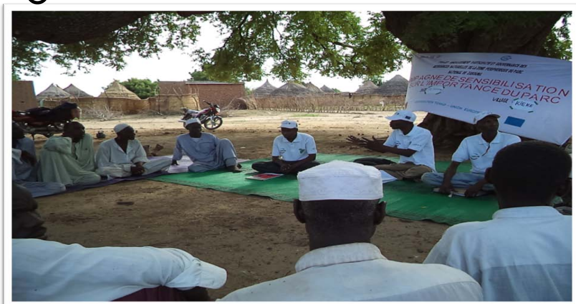
Fig1 : Sensibilisation de leaders communautaires sur le thème : Importance du Parc National de Zakouma