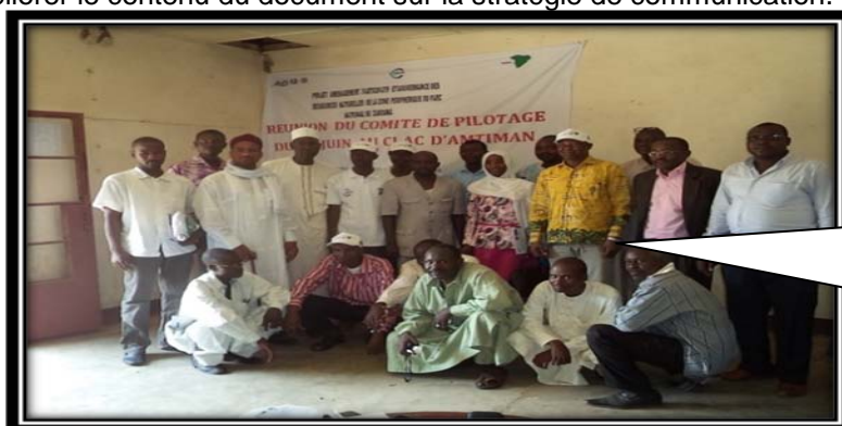
Image 1 : Première réunion du Comité de pilotage sur l'état d'avancement semestriel des activités PAP- GNR