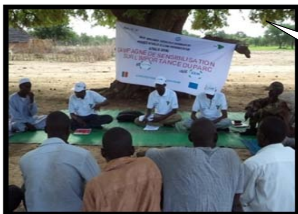
Image 5 : Visibilité sur la banderole au cours d'une séance d'animation

Affichage de banderoles exprimant le partenariat entre UICN et l'Union Européenne lors de l'atelier de lancement des activités du projet et autres séances d'animation;