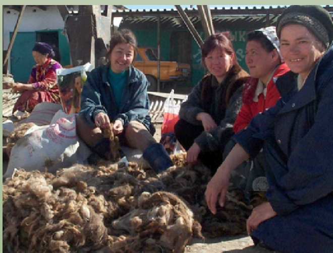
Mercado de cashmere, Kirguistán

Una comparación de los sistemas de producción rancheros y ganaderos en África 4 demuestran que aun en términos solamente de productos directos, la ganadería produce de dos a diez veces más que los ranchos comerciales bajo igualdad de condiciones. Los ranchos del Territorio Norte de Australia producen solamente el 16% de la energía y el 30% de la proteína por hectárea del que produce el sistema ganadero de los Boranas de Etiopía mientras que en los sistemas transhumanes de Malí al menos dos veces la cantidad de proteína por hectárea que producen los ranchos de los EE UU y Australia.