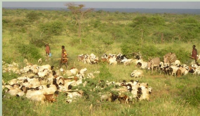
Rebaño ganadero en Uganda

En Mongolia, el pastoralismo ha sido recapacitado a través del apoyo gubernamental al proceso de toma de decisión sobre el manejo de los recursos naturales la movilidad. Como resultado directo, extensas superficies de los pastizales sido rehabilitados, las condiciones del medio ambiente han mejorado, la infraestructura esta mantenida y el acceso a los recursos mejorado. Esta conservación, como resultado del pastoralismo mejorado, ha conseguido levantar los ingresos por mas del 100% y ha reducido el numero de hogares pobres (NZNI, 2006).