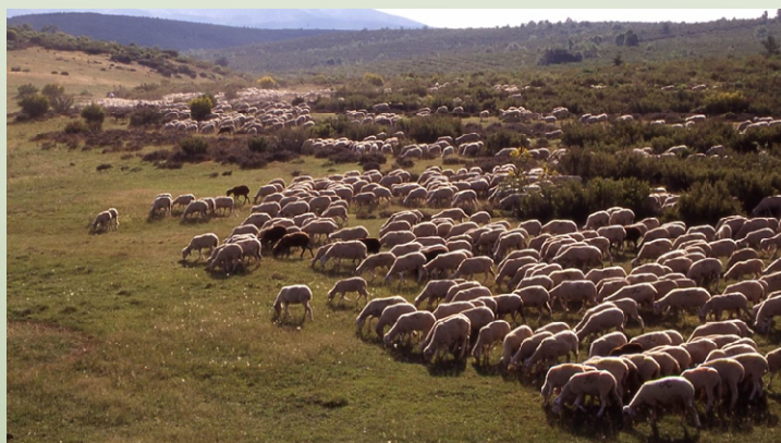
Rebaño ganadero en España

Sin embargo muchos sistemas de pastoreo se han visto debilitados por políticas que se han desarrollado que consideran que el pastoralismo o la ganadería es un sistema arcaico y poco razonable desde el punto de vista económico que necesita de modernizar y remplazar. Los sistemas de producción que han sido presentados como alternativos 'modernos' al pastoralismo y la ganadería han resultado ser menos productivos y con más efectos que perjudican el medio ambiente. Al rechazar el pastoralismo por considerar que no es productivo, los planificadores del desarrollo ha de invertido en los escasos recursos en sistemas alternativos de producción que ni son económicamente viables ni apropiados para el medio ambiente.