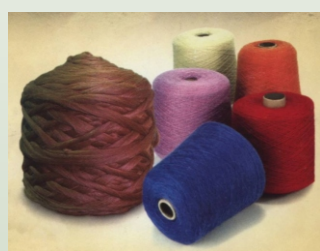
Lana de alpaca, Perú