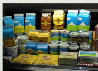
Leche del camello nómada, Mauritania

Sin embargo, estos detalles han de ser comprendidos como condición que favorezca para el reconocimiento de los costos de modernización, o de la conversión de los pastizales y las zonas de abundantes recursos. El Marco de la Evaluación Económica Total 6 proporciona un buen instrumento que posibilita capturar la amplia gama de valores asociados con la ganadería.