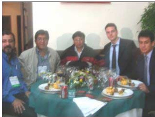
Compartiendo la mesa con representantes de Ecuador y Colombia.