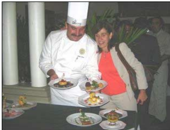
Presentación de los platos por el Chef

Esta reunión, trato de resaltar la integración de los hermanos de los países integrantes, desarrollando la relaciones económico-productivo, comercio, biodiversidad, entre otros, para lo cual se presentó el Menú, preparado por Chef de los países andinos, se ha degustado aperitivos, entradas, platos principales, postres en base a los productos característicos de los países de la Comunidad Andina; en esta reunión nos integrarnos para dar a conocer a la organización que representamos. Esta Actividad se ha realizado con el apoyo de Comunidad Andina, CAF, UNCTAD, Ministerio del Medio Ambiente de Brasil, Sociedad Peruana del Medio Ambiente BIODAMAZ Perú Finlandia.